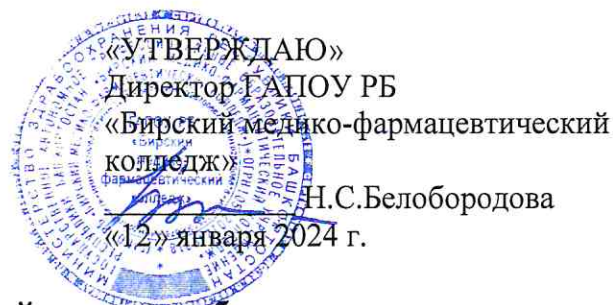
График проведения срезов знаний для самообследования. Специальность 31.02.01 Лечебное дело - ответственная Колонских Е.Г.