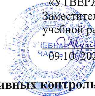
График проведения административных контрольных работ