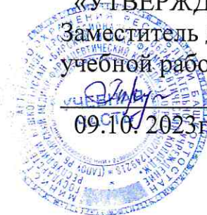
График проведения административных контрольных работ